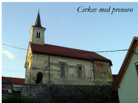
Cerkev med prenovo

Cerkev Sv. Duha je bila več desetletij zapuščena, brez oken in stropa ladje, zato je bila idealno zatočišče za netopirje. Uporabljali so celoten objekt, razen zvonika, v katerem so bili golobi.