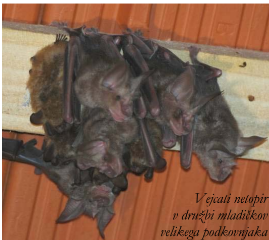
Vejicati netopir v družbi mladičkov velikega podkovnjaka

Več informacij: Javni sklad za kulturne dejavnosti, Helena Vukšinič, po tel: 07 306 1190.