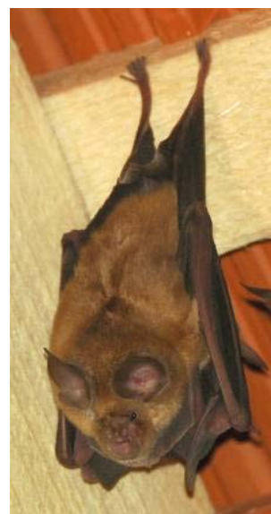
Samica velikega podkovnjaka z mladičem na prsib